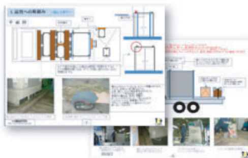
品質管理マニュアル (例)